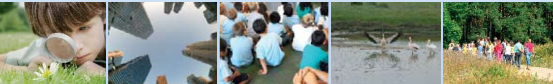
Έκδοση απολογισμών σχετικά με τις οικονομικές, περιβαλλοντικές και κοινωνικές επιπτώσεις