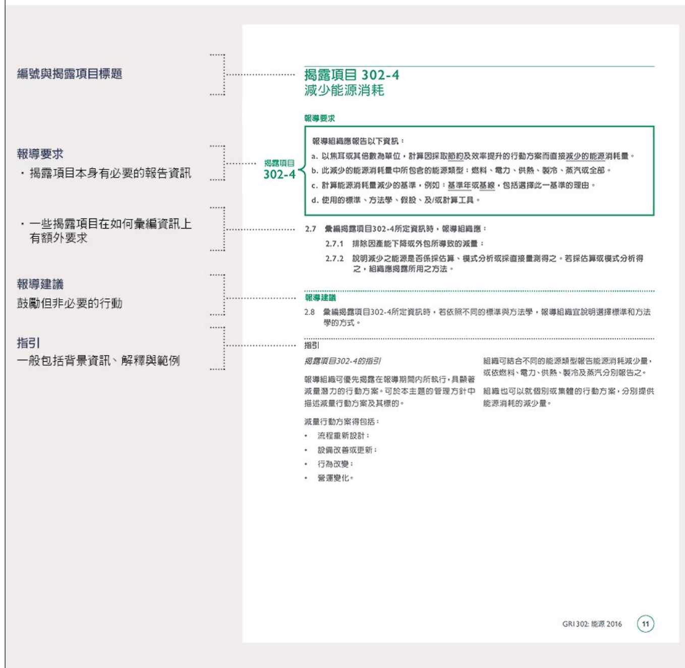
圖 2 來自於一個特定主題GRI準則的範例頁面